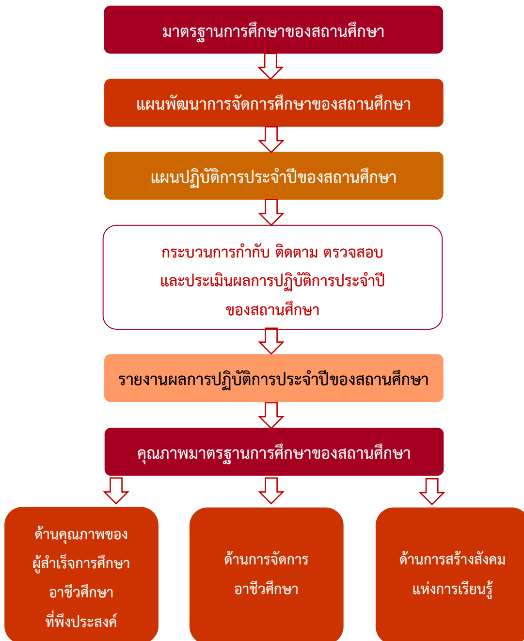
ภาพที่ 2 ความสัมพันธ์ของมาตรฐานการศึกษา แผนพัฒนาการจัดการศึกษาของสถานศึกษา และแผนปฏิบัติการประจำปีของสถานศึกษา